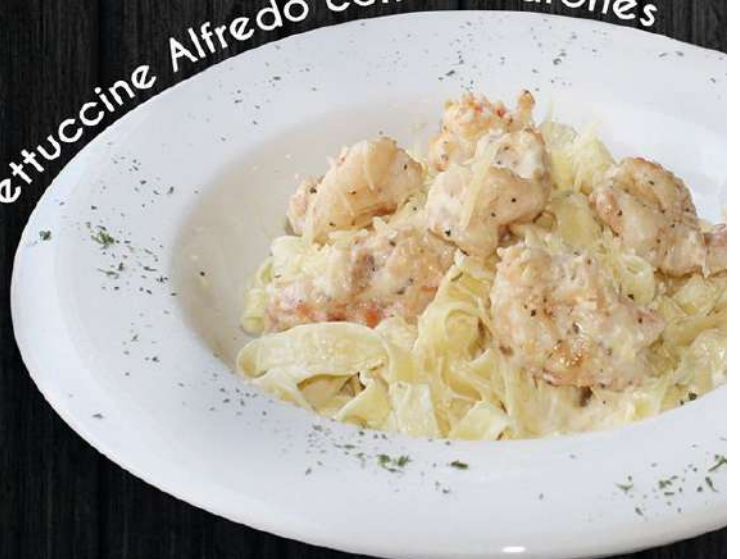
Fettuccine Alfredo con Camarones