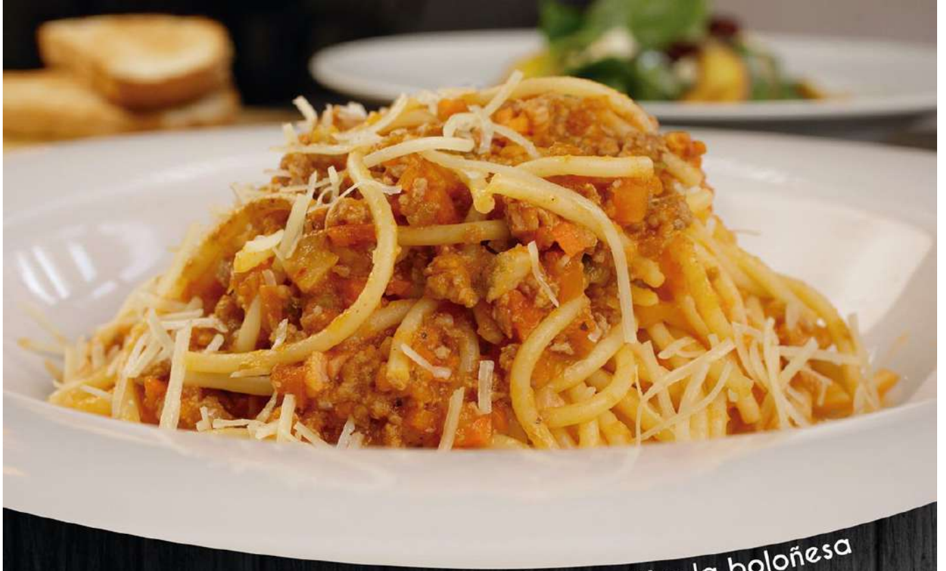
Spaguetti a la boloñesa