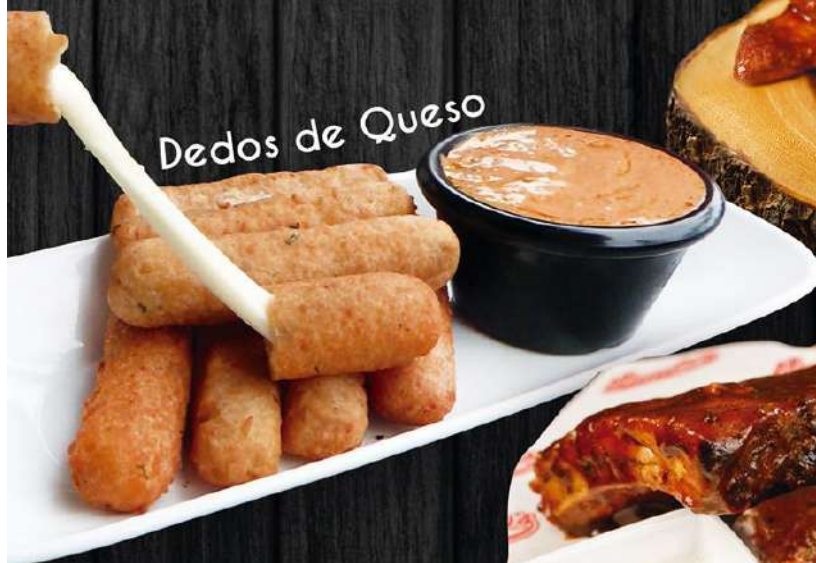
Dedos de Queso