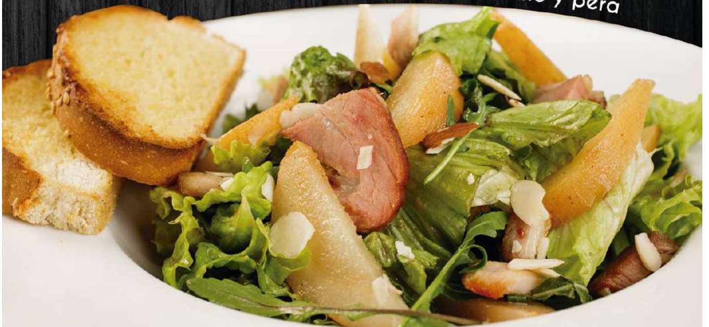
Ensalada arúgula, tocino y pera

+ POLLO (80gr) $40.- PAVO (140gr) $60.- CAMARONES (120gr) $80.-