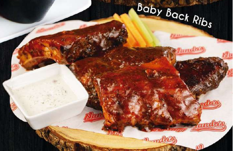
Baby Back Ribs