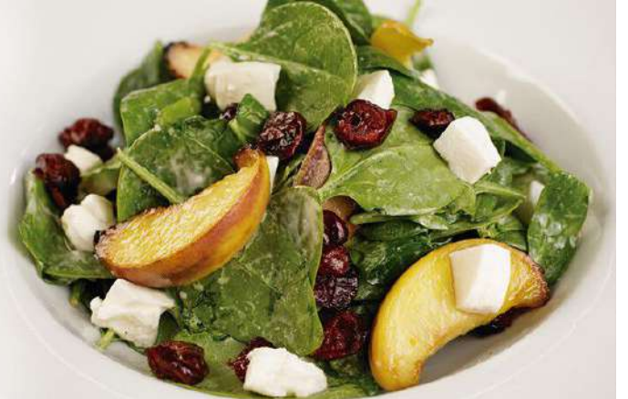
Ensalada Durazno mozzarella