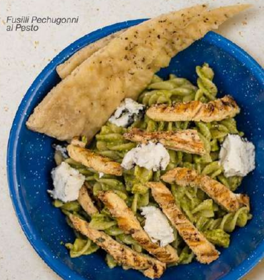
Fusilli Pechugonni al Pesto

*La Porción de todas nuestras pastas es individual.